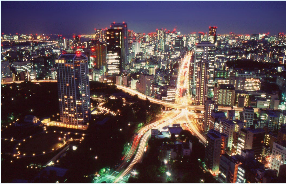
Tokyo au Japon